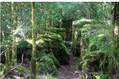
El laberinto de Nébias