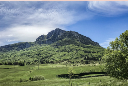
Pico de Bugarach