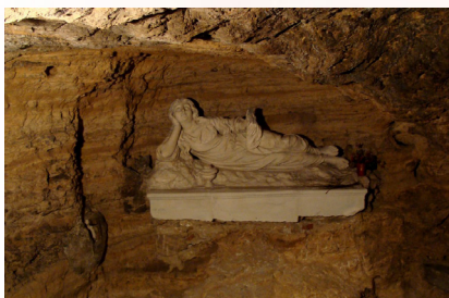
Escultura de María Magdalena