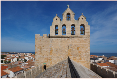
Fortaleza de Saintes Maries de la Mer