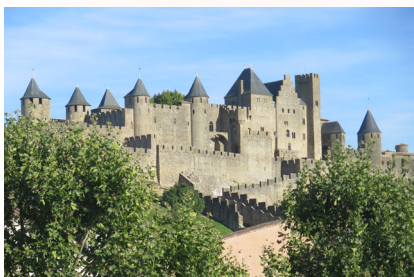
Castillo de Carcassonne