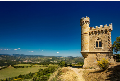
Rennes le Châteaux